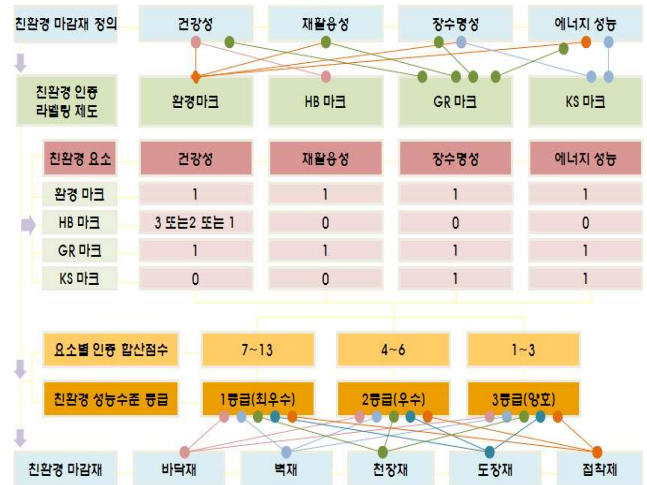
그림 2. 친환경 인증제도의 평가기준을 이용한 친환경 성능 판정기법

2개 이상의 인증마크 이상을 획득한 제품 중 환경마크나 GR마크를 획득하고 추가로 HB마크 1등급을 획득하면 최소 7점(환경이나 GR마크+HB마크 1등급), 환경마크나 GR마크를 획득하고 추가로 HB마크 3~1등급과 KS마크까지 3개의 인증마크를 획득한 제품은 7(환경이나 GR마크+HB마크 1등급+KS마크)~10점(환경이나 GR마크+HB마크 1등급+KS마크), 환경마크와 GR마크, HB마크 3~1등급 및 KS마크 4개의 인증마크를 모두 획득하면 11점(환경마크+GR마크+HB마크 3등급+KS마크)~13점(환경마크+GR마크+HB마크 1등급+KS마크)이며, 친환경 성능 1등급(최우수)으로 구분한다. 이와 같은 척도를 바탕으로 친환경 수준별 등급은 다음의 <그림 2>과 같이 친환경 성능수준을 판정하는 체계적인 기법으로 재정립할 수 있다.